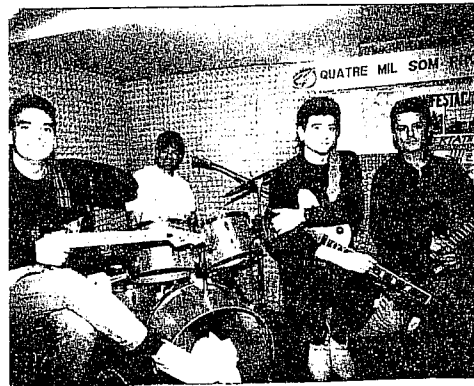
QUATRE MIL SOM A PROU

Estamos admirados y nos da fuerza vuestra lucha, lucha que es también la de la clase obrera de los Países Catalans, y ella nos anima a seguir luchando."